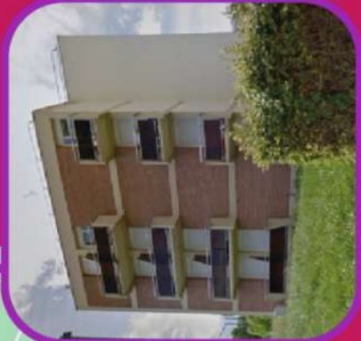
LA RÉSIDENCE THIOLETTES 77 AVENUE DE L'EUROPE

📞 03.26.79.11.20 🌐 assonoeelpaindavoine.fr