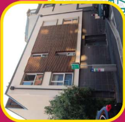
LA RÉSIDENCE GASTON BOYER 104 RUE MONT D'ARENÉ