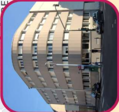
LA RÉSIDENCE PAINDAVOINE 1 RUE LIEUTENANT HERDUIN